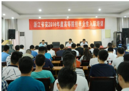
公司为新入职的大学生们举行入职培训开班仪式