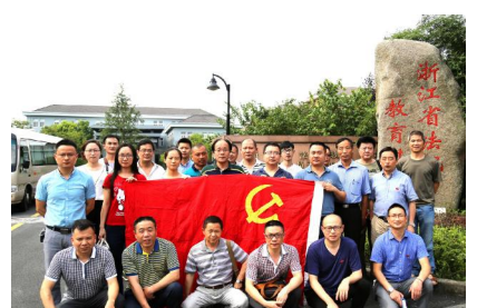
二分和空分工程分公司组织党员前往省法纪教育基地参观学习