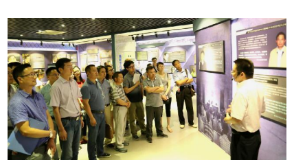
四分公司组织党员前往杭州市南郊监狱接受警示教育