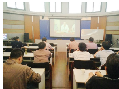
五分公司以视频形式参加浙建集团分公司经理工作交流会学习集团领导的讲话