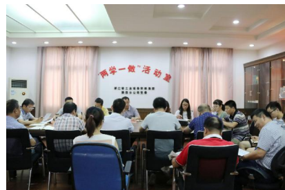
四分公司本部党支部召开“两学一做”学习教育第二专题学习研讨会