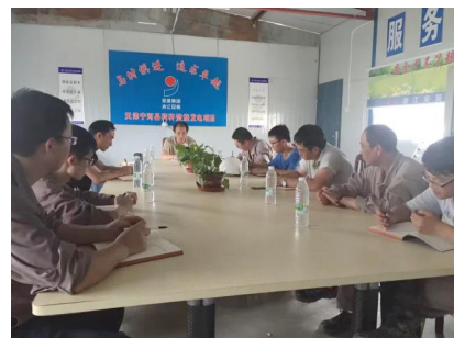
天津宁河项目党支部召开“两学一做”学习教育第二专题学习研讨会