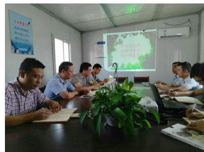
江西九江项目党支部召开“两学一做”学习教育第二专题学习研讨会