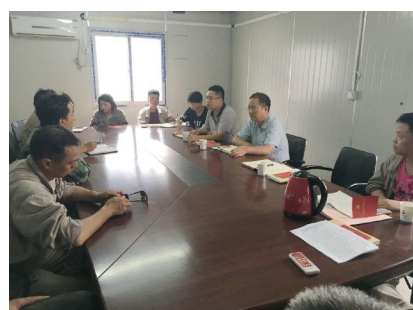
嘉兴化工项目党支部召开“两学一做”学习教育第二专题学习研讨会